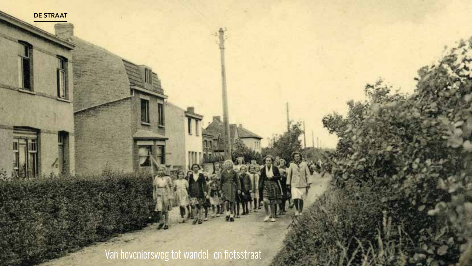
Van hoveniersweg tot wandel- en fietsstraat