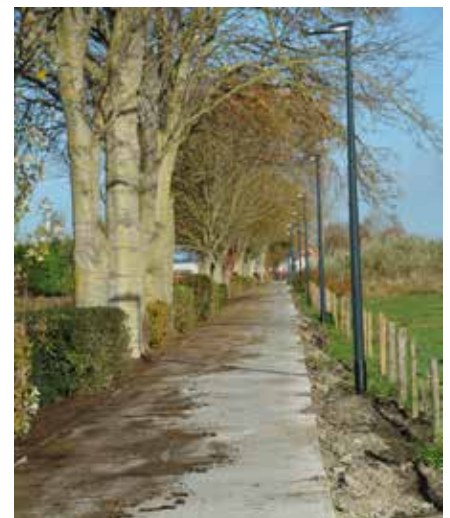
Nieuwe tramwegel - Leffinge

Begin februari plant de afdeling wegen en verkeer van de Vlaamse Overheid asfalteringswerking op de Vaartdijk-Zuid richting Leffingebrug. De Vaartdijk-Zuid wordt volgens de planning volledig afgesloten.