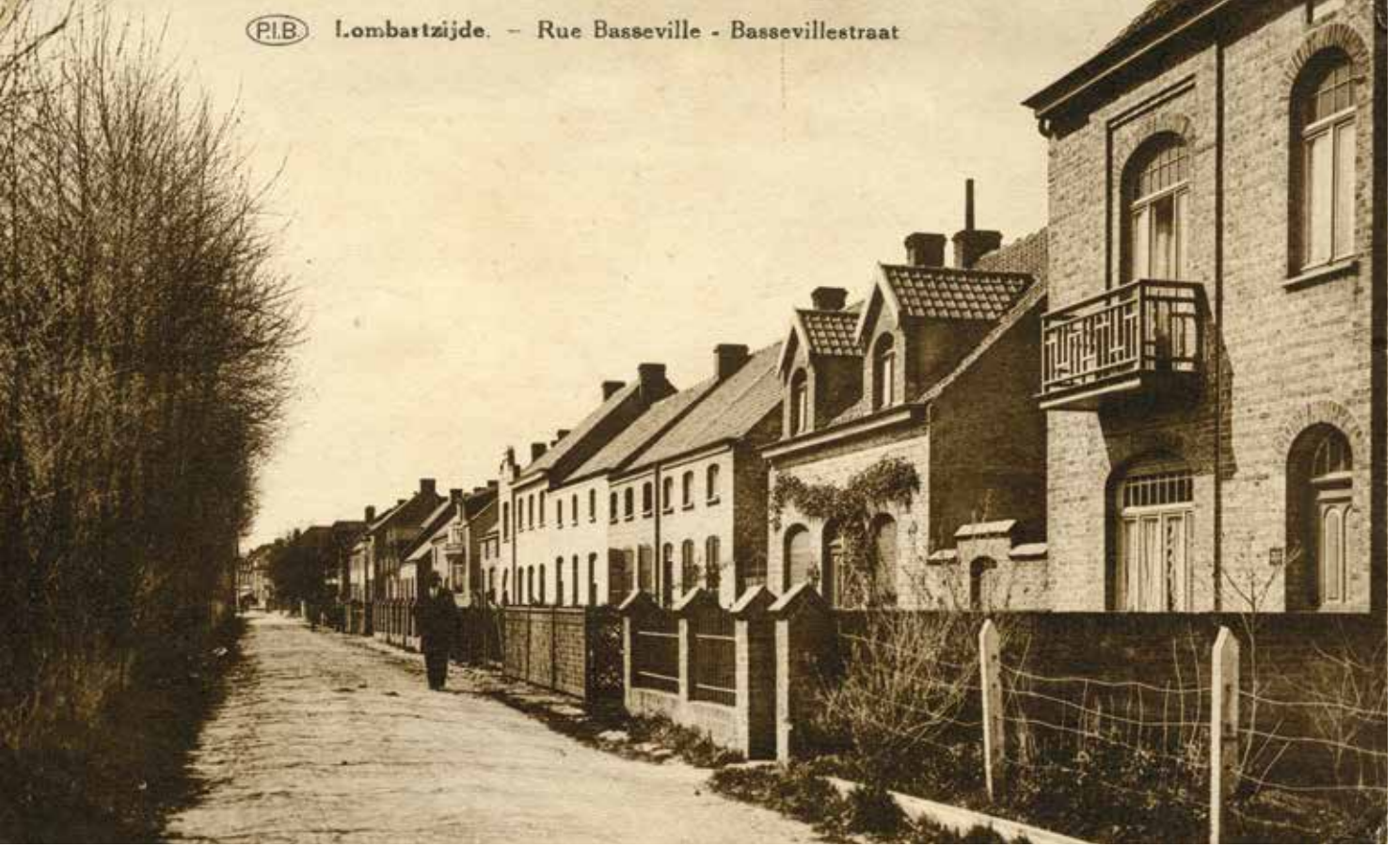
Straatbeeld richting Lombardszijde